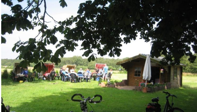
Eselhofcafe in Krumstedt

Unter der neuen Überdachung beim Umkleidegebäude wurde gegrillt und die Grillmeister bereiteten reichlich Bratwurst und Nacken zu.