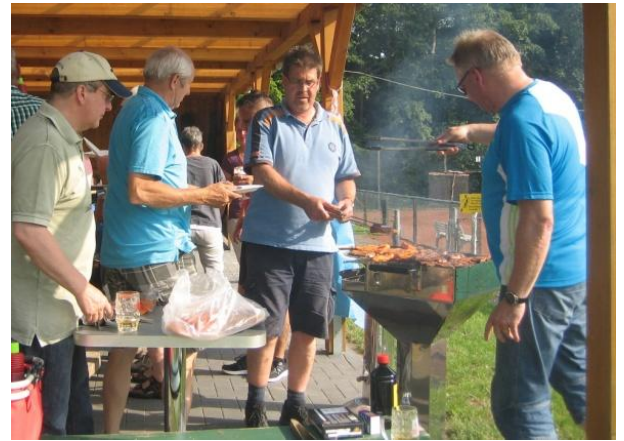
unser Grillausschuss bei der Arbeit

Es sind alle satt geworden. Mit Wein, Sekt und Bier, aber auch alkoholfreien Getränken, endete eine gelungene und gesellige Veranstaltung in den Abendstunden. Fazit: Wir sollten auch im nächsten Jahr wieder eine Fahrradtour anbieten.